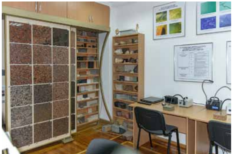
Сучасні навчальні класи ДГЦУ

для оцінки декоративного каменю запрошували експертів з Італії, Франції та інших держав – лідерів каменедобувної і каменепереробної промисловості.