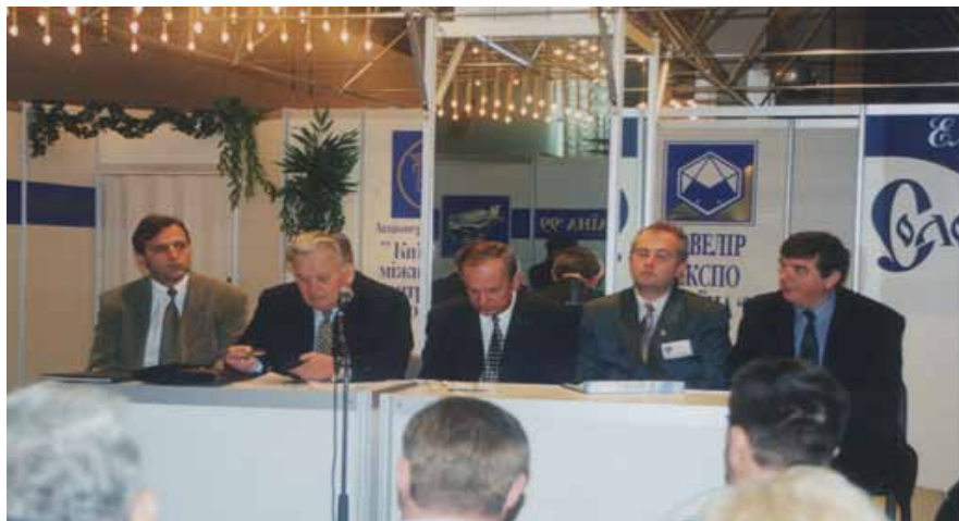
Журі конкурсу «Краща ювелірна прикраса року». Виставка «Ювелір Експо Україна», 1999

Для оприлюднення довідкових показників вартості природного каміння, а