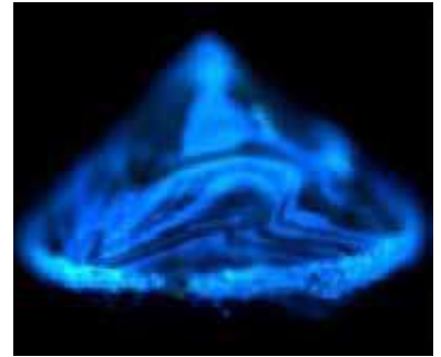
Рисунок 3. Флуоресценція природного облагородженого за кольором алмаза зелено-блакитного кольору. Огранування Кр-57. Вид з боку павільйона. Фіксуються спотворені структури росту

Причиною таким чином розподіленої флуоресценції може бути неоднорідність складу діамантів або їх облагородження.