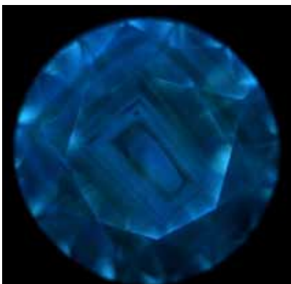
Рисунок 1. Флуоресценція огранованої вставки монокристала природного алмазу. Огранування Кр-57. Вид з боку корони. Чітко простежуються структури росту за октаедром

• У каменях природного походження добре простежуються структури росту у вигляді «річних кілець», спостерігаються онтогенічні закономірності росту за кубом та октаедром (рис. 1) або їх фрагменти.