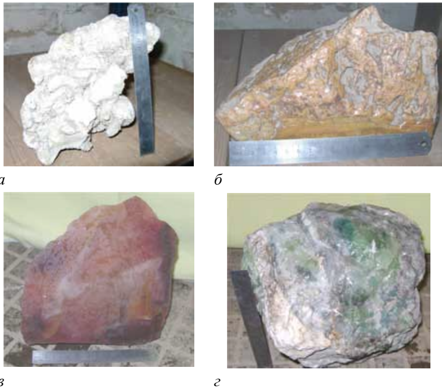
Рисунок 2. Зовнішній вигляд деяких геологічних тіл напівдорогоцінних каменів: а – кахолонг; б – агат-переливт; в – халцедон; г – флюорит

Важливим завданням є визначення величини m . Для більшості напівдорогоцінних каменів мінімальний розмір каменю приблизно відповідає обсягу, прийнятому нами за одиничний [4–6]. Тому для деяких видів напівдорогоцінного каміння (агату, халцедону, сердолику, хризопразу, кахолонгу та ін.) цей коефіцієнт не може бути застосовним через відносно невеликий їх розмір. На рис. 2 представлений зовнішній вигляд