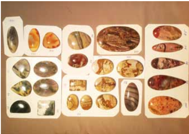
Рисунок 1. Кабошони