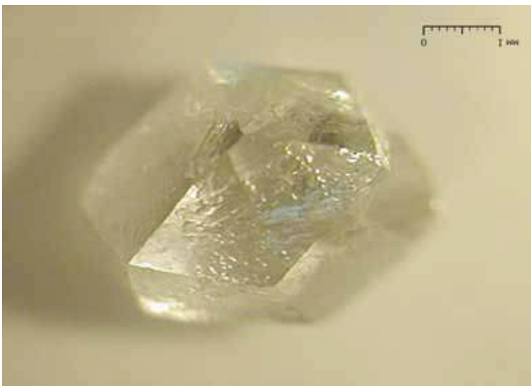
Рисунок 3. Кристал алмазу ювелірної якості. Розмір 3 мм

Характерними морфологічними ознаками напівкруглих кристалів є сніповидне штрихування, діагональна шаруватість на октаедричних гранях, плоскодонні виступи, що представляють фрагменти дитригональних шарів. Є переконливі докази утворення подібних скульптур під час розчинення алмазу на початкових стадіях процесу,