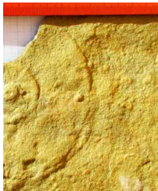
Фото 1. Ediacaria flindersi Sprigg

Прояви викопних решток багатоклітинних організмів едіакарського періоду (635–542 млн років) малопоширені на земній кулі, а деякі види належать до досить рідкісних і є об'єктом уваги і задрожів багатьох визначних музеїв та колекціонерів світу, які й досі не мають їх серед своїх експозицій (фото 1, 2, 3).