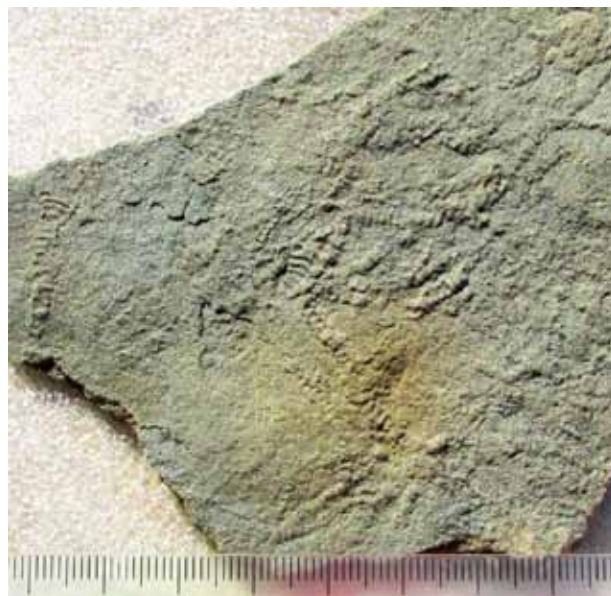
Фото 3. Palaeopascichnus delicatus Palij

Неприродно зневажливе ставлення державних органів не тільки до венду. Україна в сучасний історичний період залишається унікальною європейською країною, на території якої можна практично безкарно добувати і продавати контрабандно за кордон бурштин, топази, берили, іншу мінеральну сировину. Навіть глину для порцеляни Чехія та Німеччина закуповує в Україні за копійки, щоб створити у себе запаси її на десятки і сотні років. У 2015 році до найнижчого впав рівень води в річках України, бо вирубка лісів перетворює нашу територію на пустелю. Прикладом є річка Рось, яка вперше за своє десятиліття повністю пересохла біля м. Богуслав. А скільки малих річок в Україні вже пересохло, а їх русла під час злив стають смертельно небезпечними не тільки в Карпатах. І це тільки верхівка великого айсберга злочинної безвідповідальності за долю наступних поколінь. З 2000 року після реформування колгоспів-радгоспів і початку масової приватизації земель майбутні покоління українців втратили назавжди перспективу на законне отримання своєї частки. Натомість земля потрапила до рук транснаціональних агрохолдингів.