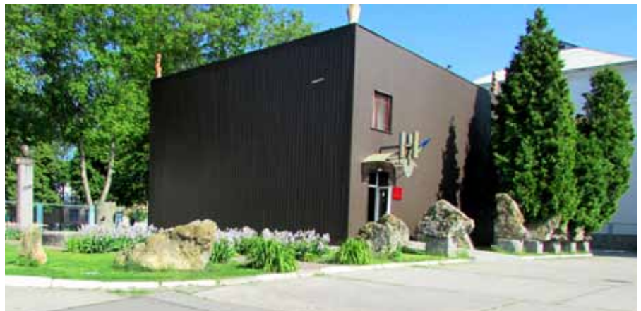
Фото 5. Приміщення Київського обласного археологічного музею (с. Трипілля)