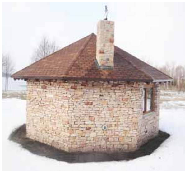
Песчаник в кладке садовой беседки