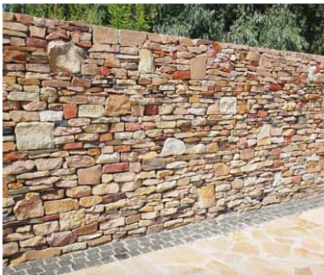
Песчаник в кладке стенки