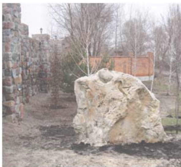
Глыба флороносного песчаника в ландшафте