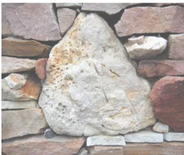
Плитка «дикого камня» в стенке

Рисунок 2. Использование эоценового песчаника в ландшафтном дизайне и строительстве.