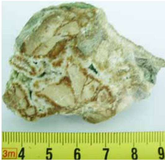
Рисунок 3 а. Кальцит-доломітові інкрустації (м. Косів, р. Рибниця)