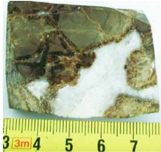
Рисунок 3 б. Кварц-карбонатна інкрустація карбонатного стяжіння (сmt Делятин, р. Прут)

Поверхня стяжінь переважно гладка. Колір їх поверхні кремовий, вохристо-бурий до чорного і залежить від якісного та кількісного вмісту вуглеводнів і карбонатів Fe, Ca, Mg. Внутрішні порожнини стяжінь інкрустовані мінералами (рис. 2 і 3 а, б), представлених рядом барит – сидерит – кальцит – доломіт – халцедон – кварц, послідовність утворення яких супроводжувалась синхронним диференційованим фракціонуванням ВВ від важких до більш легких. Вільний простір інкрустацій в окремих стяжіннях заповнений озокеритом або нафтою.