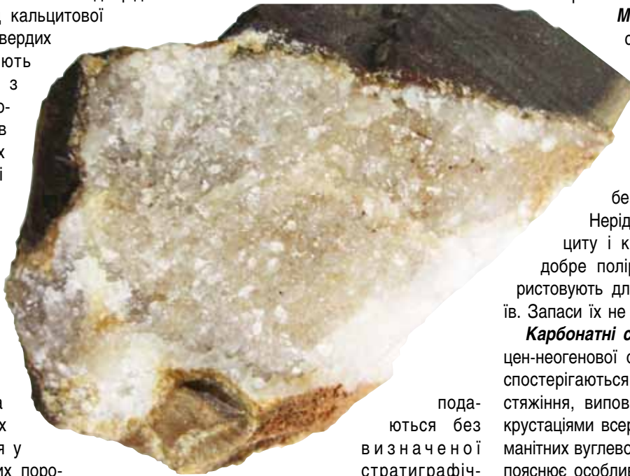
Рисунок 2. Кварцова інкрустація внутрішньої поверхні карбонатного стяжіння

Бурштин. Одиначні знахідки бурштину в Косові, Космачі, Делятині, Мізуні