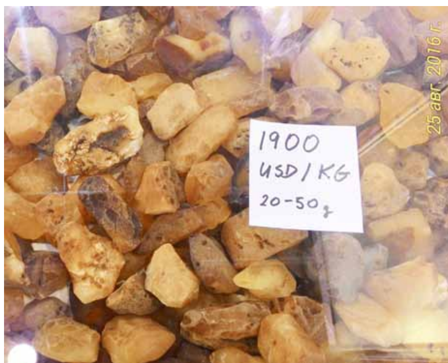
Рисунок 2. Пропозиція бурштину фракції 20-50 г на «Ambermart 2016»