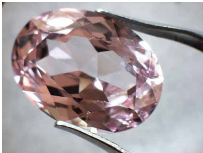
Рисунок 1. Синтетична шпінель. Збільшення 8 x

Дослідження методом якісного РФА проводилося відповідно до «Методики діагностика дорогоцінного каміння та його заміників методом рентгенофлуоресцентного аналізу» [2] з використан-