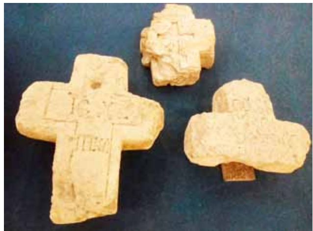
Рисунок 1. Козацькі хрести в експозиції Дніпропетровського національного історичного музею ім. Д.І. Яворницького

A petrographic study of the raw stone materials used for the production of Cossacks' stone crosses from the collection of Dnipropetrovsk National Historical Museum named after D.I. Yavornytskyi was carried out. The places of probable origin of the raw stone materials were determined.