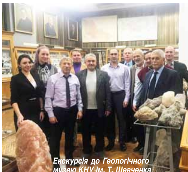
Екскурсія до Геологічного музею КНУ ім. Т. Шевченка