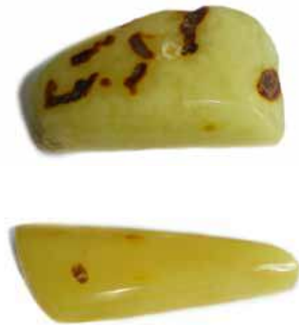
Рисунок 1. Копал у сировині (1) та термооброблений копал (2)