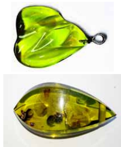
Рисунок 2. «Зелений бурштин» – результат багатостадійної термообробки копалу