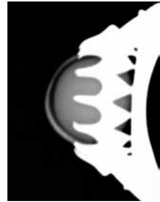
Рисунок 4. Радіографічний знімок дуплету перлина/перламутр