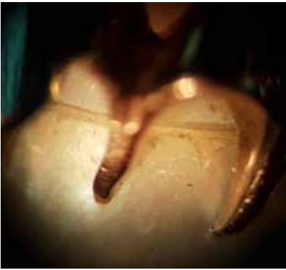
Рисунок 2. Місце з'єднання складових частин дуплету перлина/перламутр, зб. 22