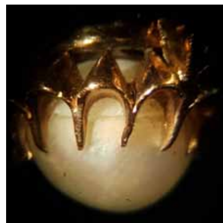
Рисунок 1. Загальний вигляд дуплету перлина/перламутр у каблучці при денному освітленні, зб. 20

напівкількісного рентгенофлуоресцентного аналізу (EXDRF) за допомогою спектрометра енергій рентгенівського випромінювання «СЕР-01» моделі «ElvaX-Light» з інтервалом досліджень від Na до U, відповідно до «Методики