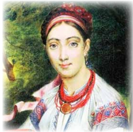
Рисунок 3. В. Тропінін «Дівчина-українка у пейзажі»