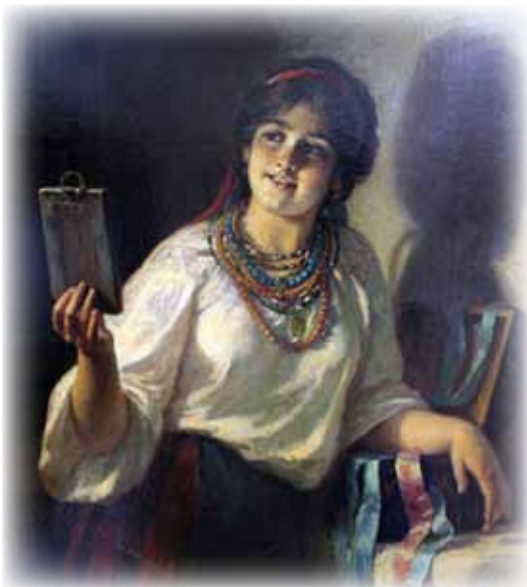
Рисунок 4. Х. Платонов «Оксана», фрагмент