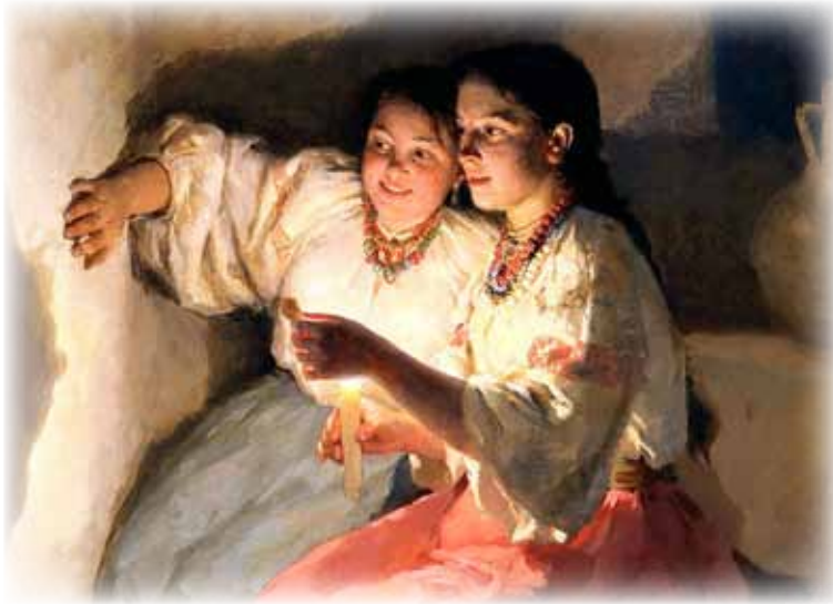
Рисунок 6. М. Пимоненко. «Різдвяні ворожіння», фрагмент

«Суперниці. Біля криниці» 1909 року. Ці картини демонструють буденне носіння коралового намиста, кількість низок якого залежить від добробуту власниці. Микола Пимоненко поправу вважається найвидатнішим художником народних мотивів, пензлі якого знайомлять сучасне покоління з побутом й традиціями межі XIX–XX століть. Його творчість висвітлює різні сфери народного життя і дає можливість дійти висновку про широку розповсюдженість коралового намиста в цей історичний період. Таким чином, протягом двох століть надзвичайно дорогий і рідкісний матеріал, привезений з далекої Італії, став широкодоступним та знайшов величезне коло шанувальників серед українського селянства.