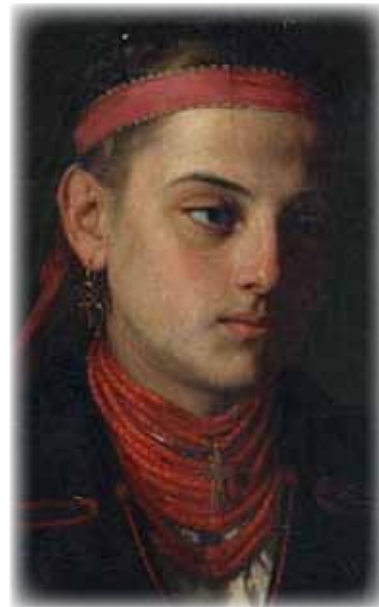
Рисунок 5. І. Соколенко «Портрет селянської дівчини», фрагмент