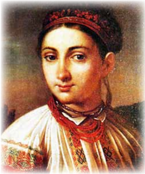
Рисунок 2. В. Тропінін «Дівчини з Поділля»